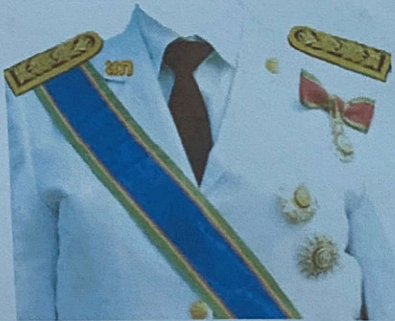
ข้าราชการบำนาญ (หญิง)

(กรณีได้รับเครื่องราชอิสริยาภรณ์ชั้นสายสะพาย ให้ประดับสายสะพายและเหรียญฯ ตามชั้นตราที่ได้รับ)