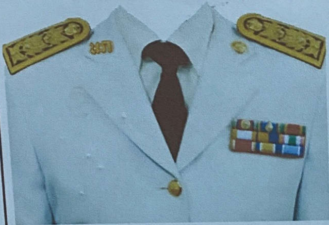
ข้าราชการบำนาญ (หญิง)

(การประดับแพรแถบเครื่องราชอิสริยาภรณ์ ให้ประดับตามชั้นตราที่ได้รับ)