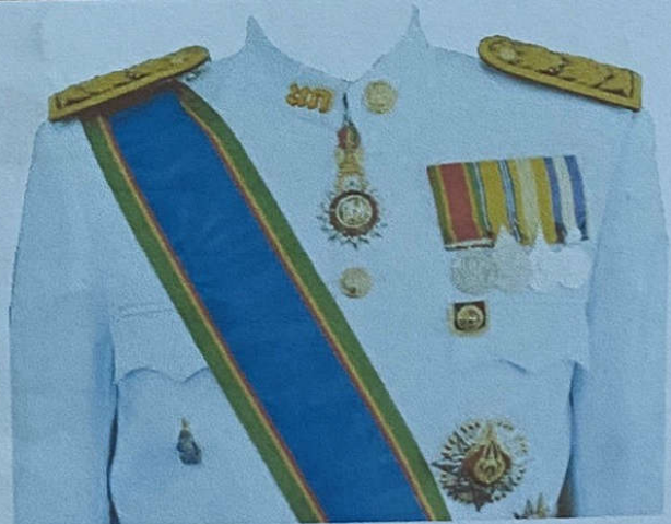
ข้าราชการบำนาญ (ชาย)

(กรณีได้รับเครื่องราชอิสริยาภรณ์ชั้นสายสะพาย ให้ประดับสายสะพายและเหรียญฯ ตามชั้นตราที่ได้รับ)