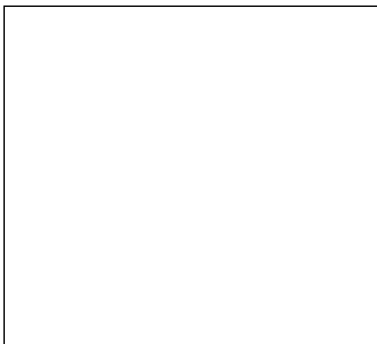
ภาพถ่ายด้านหน้าอาคาร